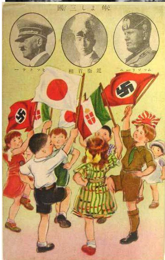
Японский плакат, пропагандирующий сотрудничество

Одновременно произошло и сближение Германии с Японией. В 1936 г. эти две страны подписали Антикоминтерновский пакт, к которому в следующем году присоединилась и Италия.