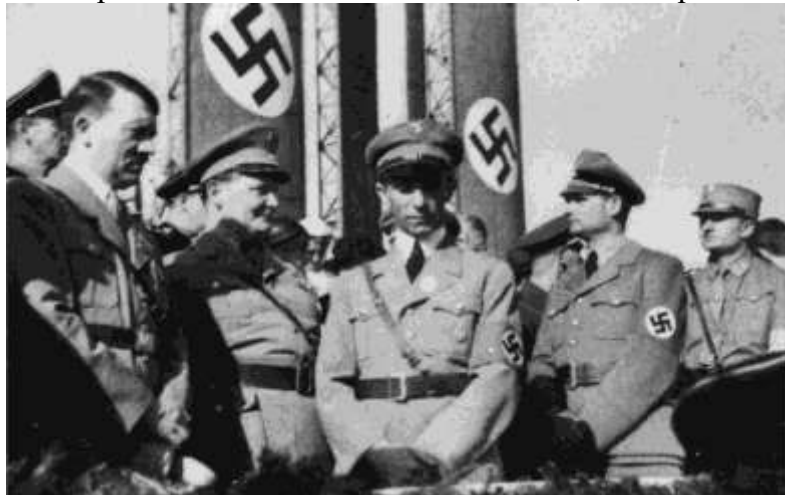
Гитлер, Геринг, Геббельс и Рудольф Гесс во время военного парада в 1933 году.

Приход к власти в Германии нацистов привёл к возникновению второго очага войны — в Европе. В 1933 г. Германия вышла из Лиги Наций. Главной внешнеполитической задачей Гитлера в первые годы после прихода к власти было снятие с Германии тех ограничений на вооружение, которые были записаны в Версальском договоре. Это удалось ему, поскольку западные лидеры испытывали давление общественного мнения, настроенного на предотвращение новой войны любыми способами, в том числе и уступками. Германия же ловко спекулировала на несправедливости Версальского договора и создавала иллюзию, что её можно отдельными уступками удовлетворить. Кроме того, многие лидеры Франции и особенно Англии не верили, что Германия сможет быстро восстановить военный потенциал даже в случае снятия ограничений — а если и восстановит, то направит агрессию на Восток, где столкнётся с СССР.