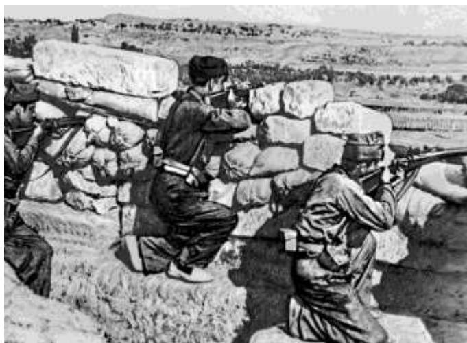
Передовой пост народной милиции обстреливает позиции националистов. 1936 г.

Республику ослабляли разногласия между силами, объединившимися в Народный фронт. Коммунисты, следуя указаниям из Москвы, «очищали» свои ряды от троцкистов и боролись с анархистами, социалисты и республиканцы не доверяли коммунистам. Странники республики развернули борьбу с католической церковью, и это оттолкнуло от них часть населения. Всё это, как и масштабная внешняя поддержка мятежников Германией и Италией, способствовало поражению республиканцев. Весной 1939 г. франкисты установили контроль над всей территорией страны. Эта победа укрепила влияние Германии и Италии.